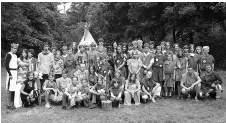
Účastníci tábora v Náměšti

Kdo se rozhodl strávit část prázdnin na táboře v Náměšti nad Oslavou určitě neudělal špatně. Tábor byl zahájen 9. 7. a nesl se v duchu Rytířů kulatého stolu. U prvního táboráku byl králi Artuši ukraden meč Excalibur. Protože je pro krále tento meč velmi důležitý, postupně slábl a ochorel a proto jsme mu museli pomoci. Nejprve jsme se ho snažili zachránit čajem z bylin, který uvařila každá skupinka, ale pak jsme zjistili, že to králi nepomůže a budeme mu muset Excalibur najít. Díky hrám, které pro nás vedoucí připravili, jsme se nenudili a nacházeli jsme různé indicie, které nás měly dovést až k meči. Předposlední den jsme se dozvěděli, že budeme spát pod širákem. Všichni jsme se na to velmi těšili, ale pohled na zataženou oblohu nám trochu nahnal strach. Naštěstí jsme v lese pod širákem přenocovali a myslím, že pro malé, ale i velké děti to byl velký zážitek. Ráno po probuzení jsme se dozvěděli, že meč Excalibur najdeme už brzy a hned na to jsme objevili královnu Morganu, která nám řekla, kde máme meč hledat. Meč jsme objevili a