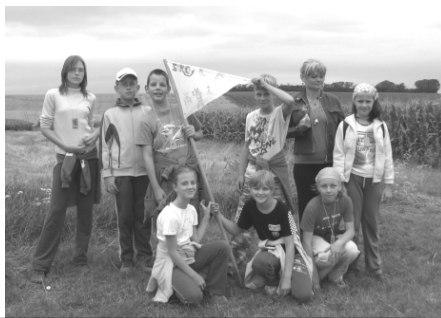
3 skupiny dětí na letním táboře