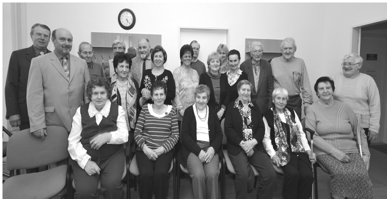
společ- né foto z oslavy