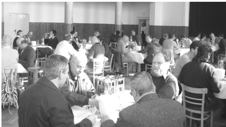
Obr. Bodování vín týden před výstavou