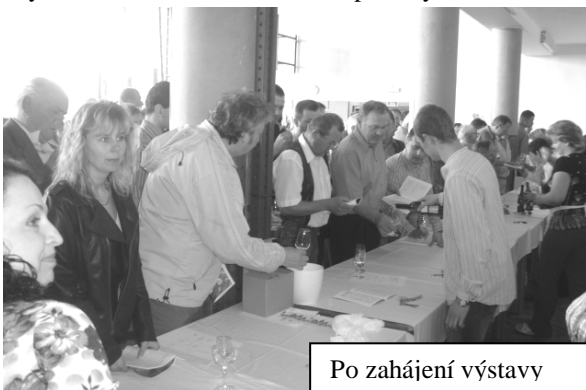
Po zahájení výstavy

Vystavováno zde bylo celkem 590 vzorků vín od 221 vystavovatelů ze 49 obcí. Výběr vín byl ze 42 odrůd, které byly rozděleny mezi 371 bílých vín a 219 červených vín, z nichž mladá vína tvořila 2/3. Nejvíce vystavovaných vín