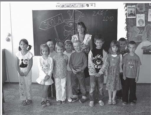
▲ Naši noví prvňáčci