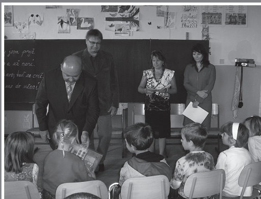
▲ Přivítání prvňáčků

Během prázdnin ve škole probíhaly některé nezbytně nutné úpravy. Byly opraveny komíny, které se