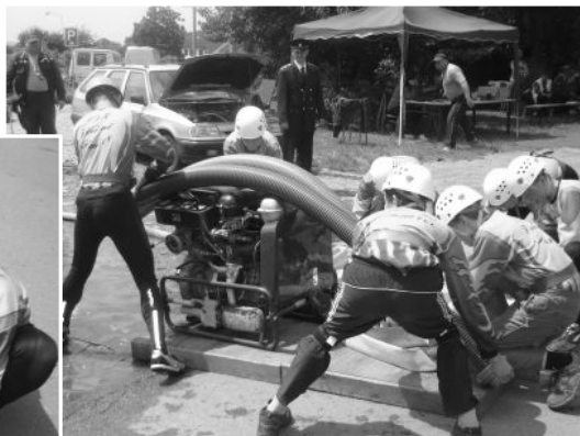
Ivanovice na Hané -