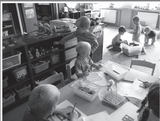
▲ U nás ve školce