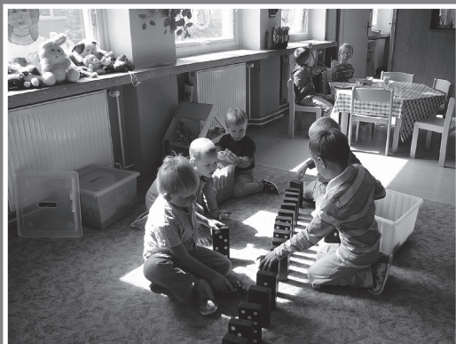
▲ U nás ve školce