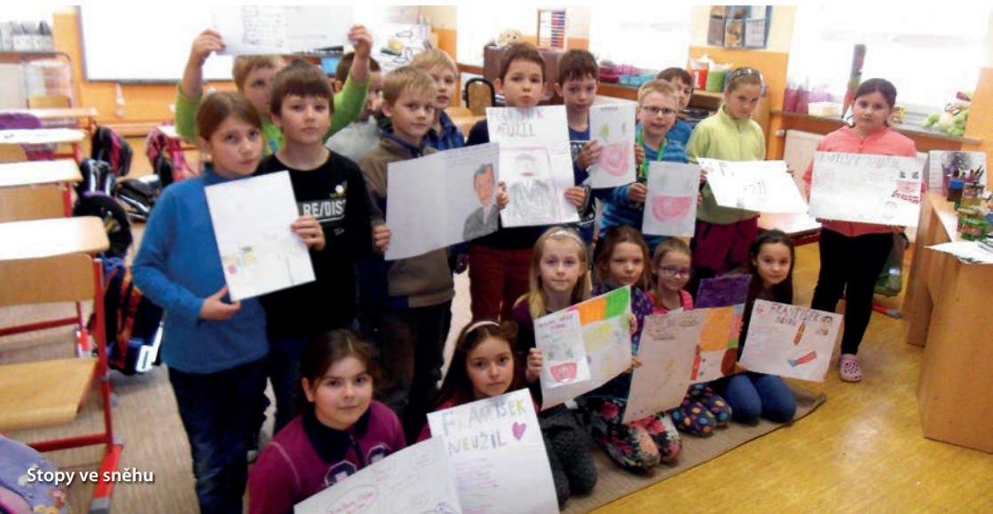
Stopy ve sněhu