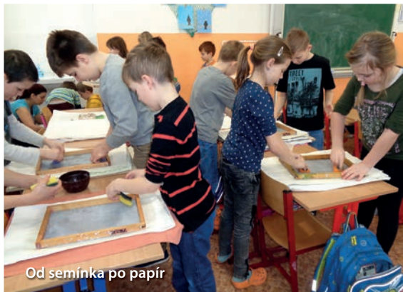
Od semínka po papír