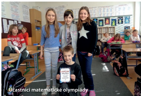
Účastníci matematické olympiády