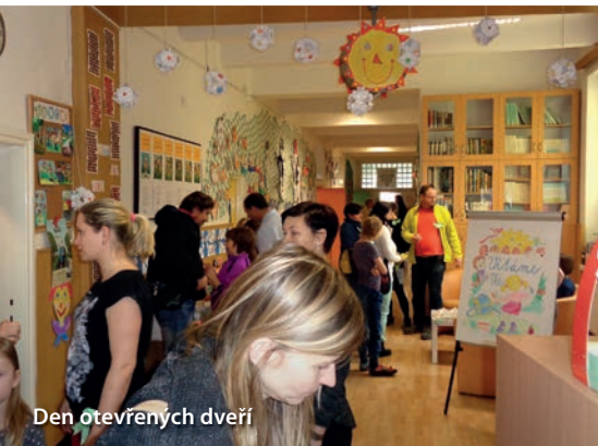
Den otevřených dveří