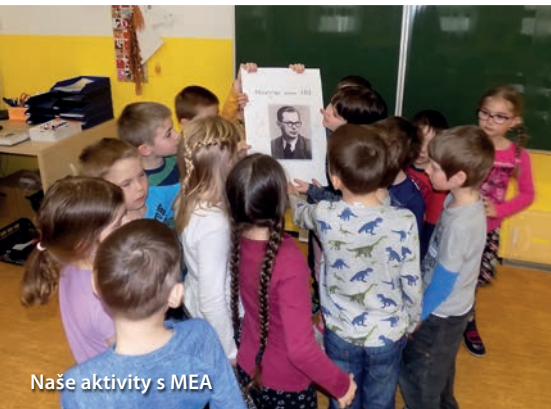
Naše aktivity s MEA