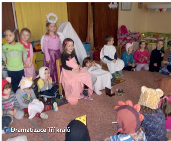
Dramatizace Tří králů