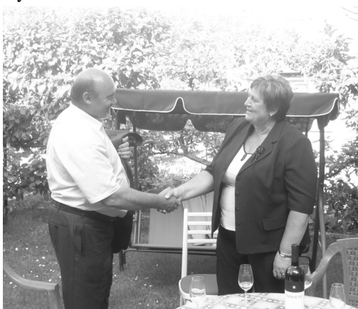
představitelé obou obcí