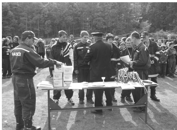
Mládež při závodě a dorost při přebírání ceny v Čučicích