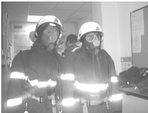
Z výcviku v Líšni