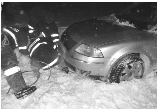
Zapadlé auto dne 8. ledna.

- 1. výjezd byl ohlášen v pátek 8.1. ve 21 00 na trase Viničné Šumice – Roušínov, Kovalovice – Velešovice a okolí Pozořic. Ve spolupráci s HZS Hlučín, který tu byl na výpomoc se dvěma tatrai 815, jsme vyjízďeli a vyprošťovali dohromady čtyři osobní automobily, které sjely do příkopu, nebo nemohly projet kvůli velké-