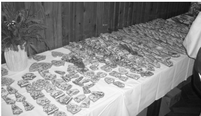
Obr.: Z výstavy perníčků v sokolovně