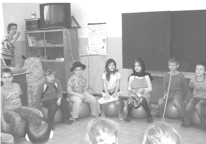
OBR: Výroba ptačích budek (nahore) a vánoční akademie - 2 třída

Dne 13. května v 16.00 hod. vás zveme na jarní akademii ke Dni matek.