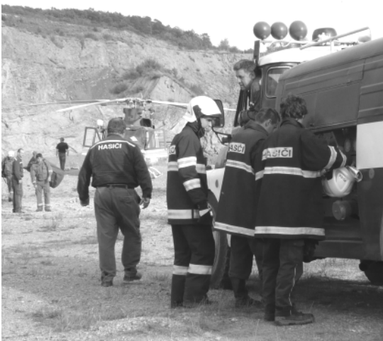
Obr. Z výcviku hasičů Ze soutěže mládeže 3. str. obálky