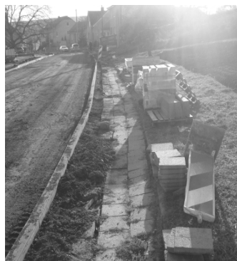
Před konečnou úpravou komunikací a pokládka nového povrchu