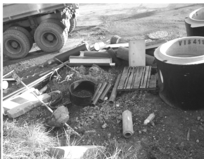
Z výstavby kanalizace na Hradské