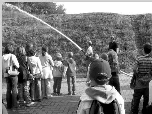
▲ Na návštěvě u hasičů