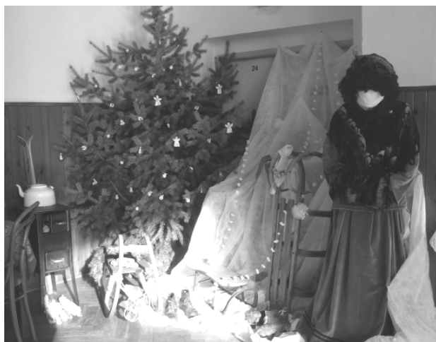
obr. koutek se staročeskou zimou