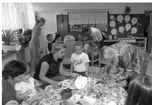
▲ Rukodělné odpoledne

„Na září na září těšili se sadaři...“ napadá mě při psaní tohoto článku. Na září jsem se opravdu těšila. Čekaly nás nové děti, noví rodiče a kde se s nimi nejlépe seznámit, než při výtvarné dílně? Děti si mohli vytvořit na třech stanovištích podzimní výzdobu svých pokojíčků. Za pomoci rodičů vytvářely svícný z dýně, veselé ovoce z papíru do oken a dráčka na zapíchnutí do květináče nebo dýně. Ráda jsem přihlížela, jak děti vydabávaly, vystřihovaly, nalepovaly, vybarvovaly a rodiče pomáhali. Myslím si, že jsme prožili příjemné odpoledne a těším se na další společná setkání. Jana Vlčková