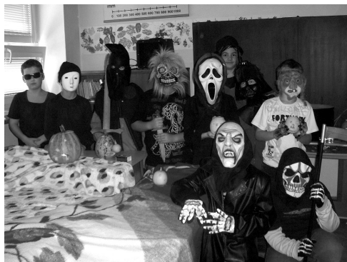
▲ Halloween u nás

Víte, jak správně oslavit původně keltský svátek Halloween? Nesmí chybět lampy z vydlabaných dýní, troška strachu na stezce odvahy strašidelnou třídou, děti v krásné strašidelných maskách, ale hlavně tradiční soutěže: lovení jablek ústy z misky plné vody nebo závody na košťatech. Přesně tak Halloween proběhl i u nás.