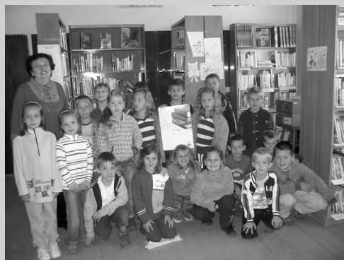
▲ Foto z pasování prvňáčků na čtenáře