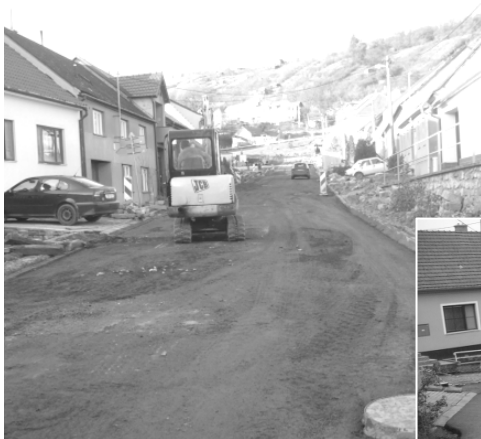
Závěrečné úpravy povrchu hlavní komunikace v obci