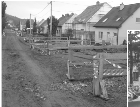
Výstavba kanalizace v Psenkách