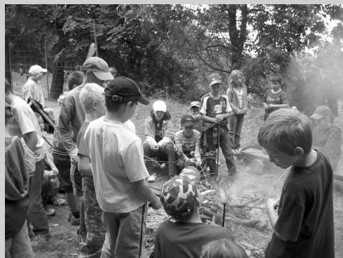
▲ Výlet na Vildenberk