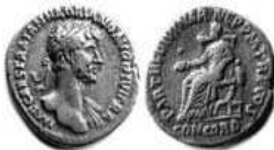
Obr. 4 Hadriánův stříbrný denár

Obr. 9: Keramika z období velatické kultury /dole/