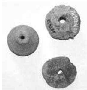
Obr. 3 Eneolitické přesleny

U „Bahňáku“ byl roku 1928 při stavbě silnice do Rousínova nalezen žárový hrob s mísovitou nádobou – (obr. 9), který je řazen do tzv. velatické kultury v mladší době bronzové. V roce 1960 bylo při kopání sklepa nalezeno slovanské sídliště s keramikou pražského typu a také přeslen, brousek a zvířecí kosti ( skotu a prasete).